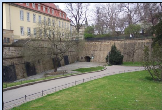
Außen- und Eingangsbereich

In den altherwürdigen Festungsmauern der Brühlschen Terrasse finden Sie zwei historische Gewölberäume sowie einen geräumigen überdachten Innenhof für Ihr individuelles Event. Auf bis zu 340m 2 wird Ihre Festlichkeit zu einem unvergesslichen Erlebnis. Durch die unterschiedlichen Räume, können Sie mit maximal 300 Personen feiern. Die Räume können auch getrennt angemietet werden.